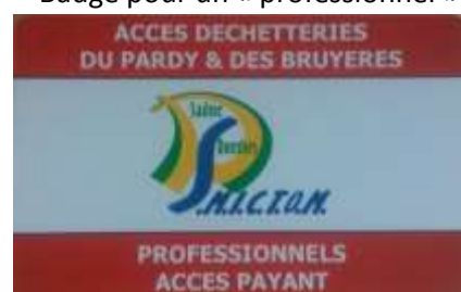
Badge pour un « professionnel »