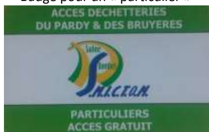
Badge pour un « particulier »

Cinquante passages seront à nouveau crédités à chaque 1 er janvier.