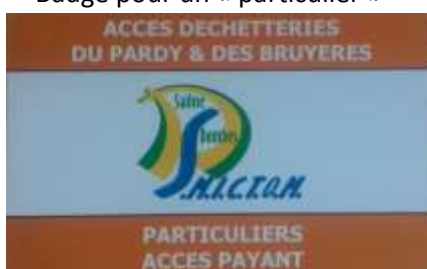
Badge pour un « particulier »