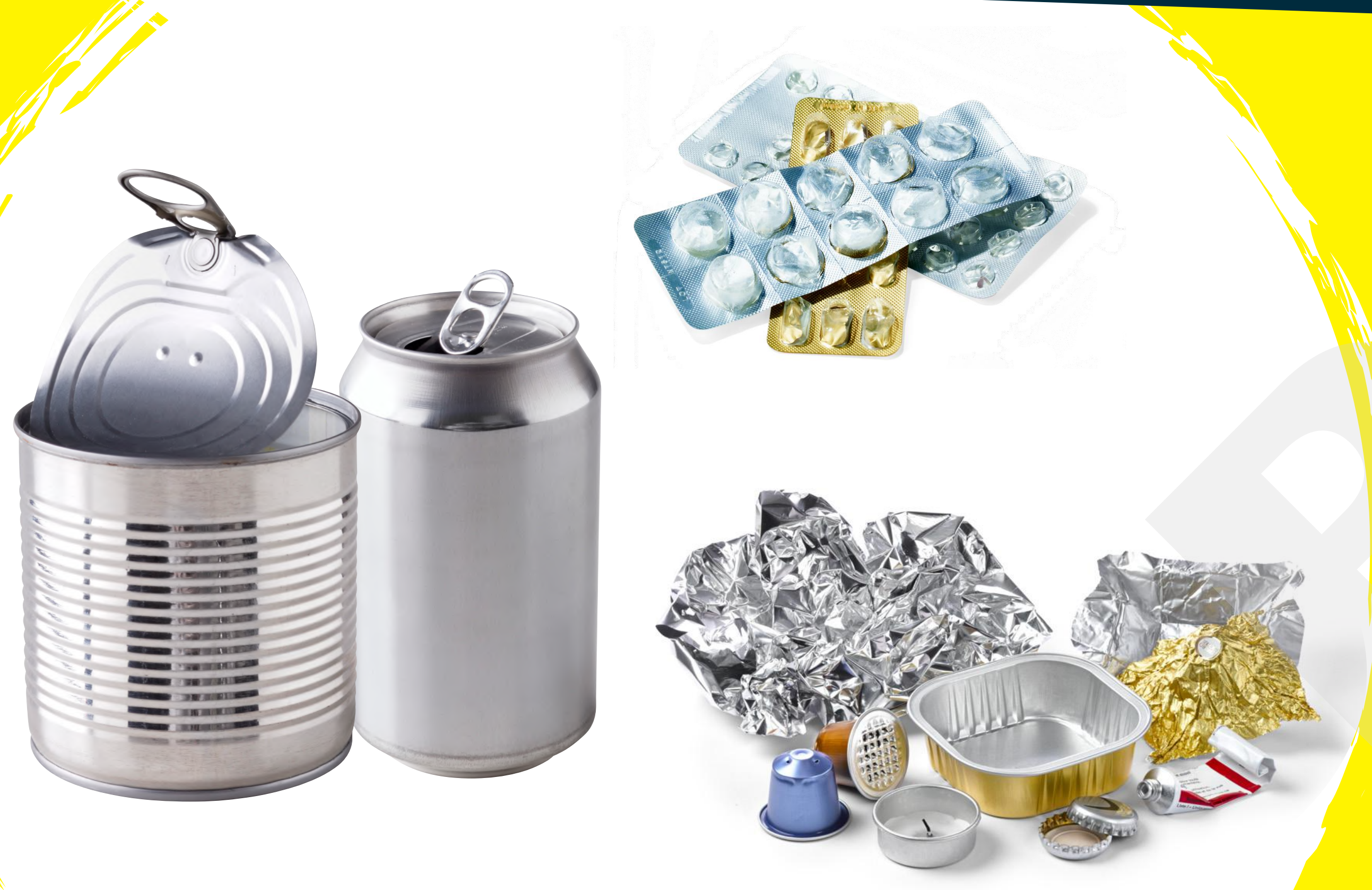
LES EMBALLAGES EN MÉTAL