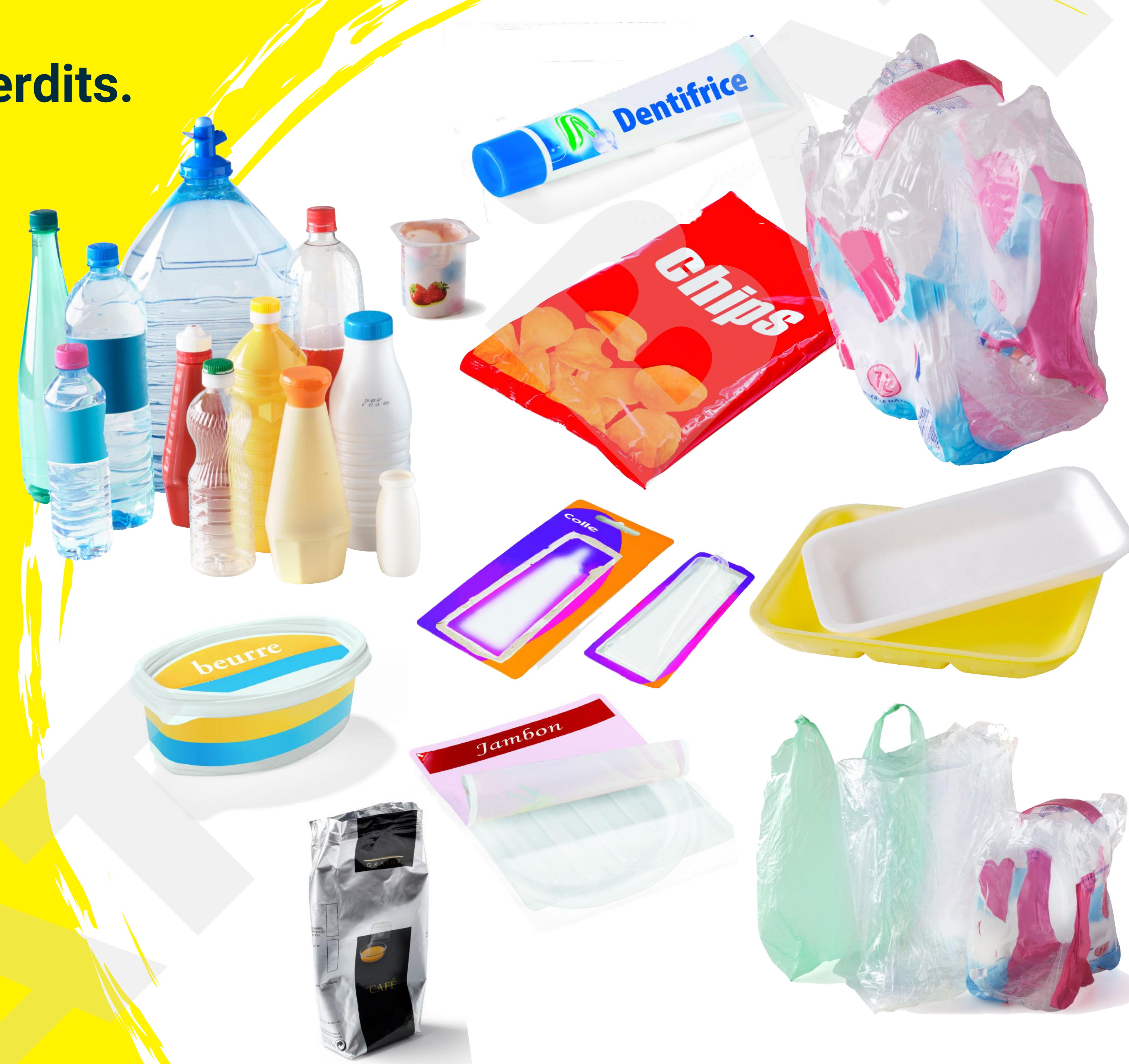
LES EMBALLAGES EN PLASTIQUE